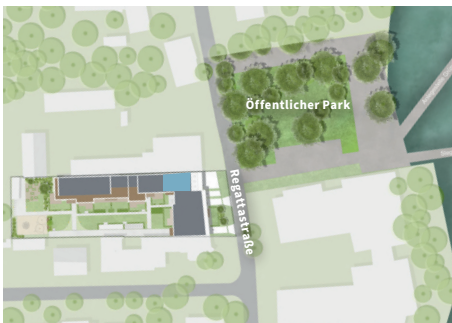
LAGE IM PROJEKT