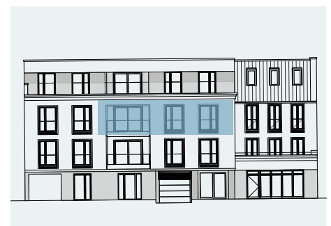
ANSICHT REGATTASTR. HAUS1

Alle Maße sind ca.-Angaben. Alle Grundrisse entsprechen dem aktuellen Stand der Planung und unterliegen laufenden Veränderungen in der Bearbeitung. Die Möblierungsvorschläge sind unverbindlich. Stand: September 2021.