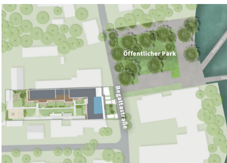
LAGE IM PROJEKT